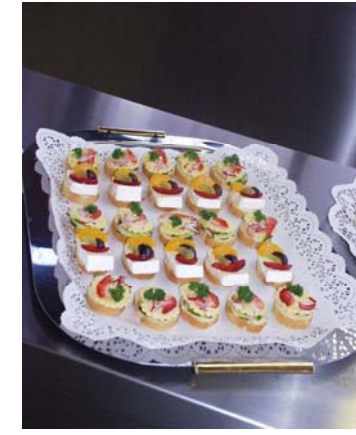
Vorbereitungen für die Einweihung einer neuen Küche Ausgeführt von der Grundstufe im Hotel- und Gaststättenbereich