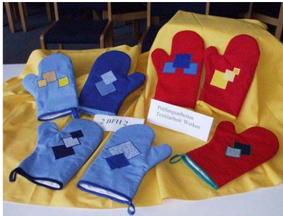
Arbeiten der zweijährigen Berufsfachschule für Hauswirtschaft und Sozialpädagogik