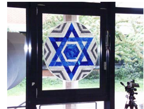
Mandala als Fensterbild, BVJ 1